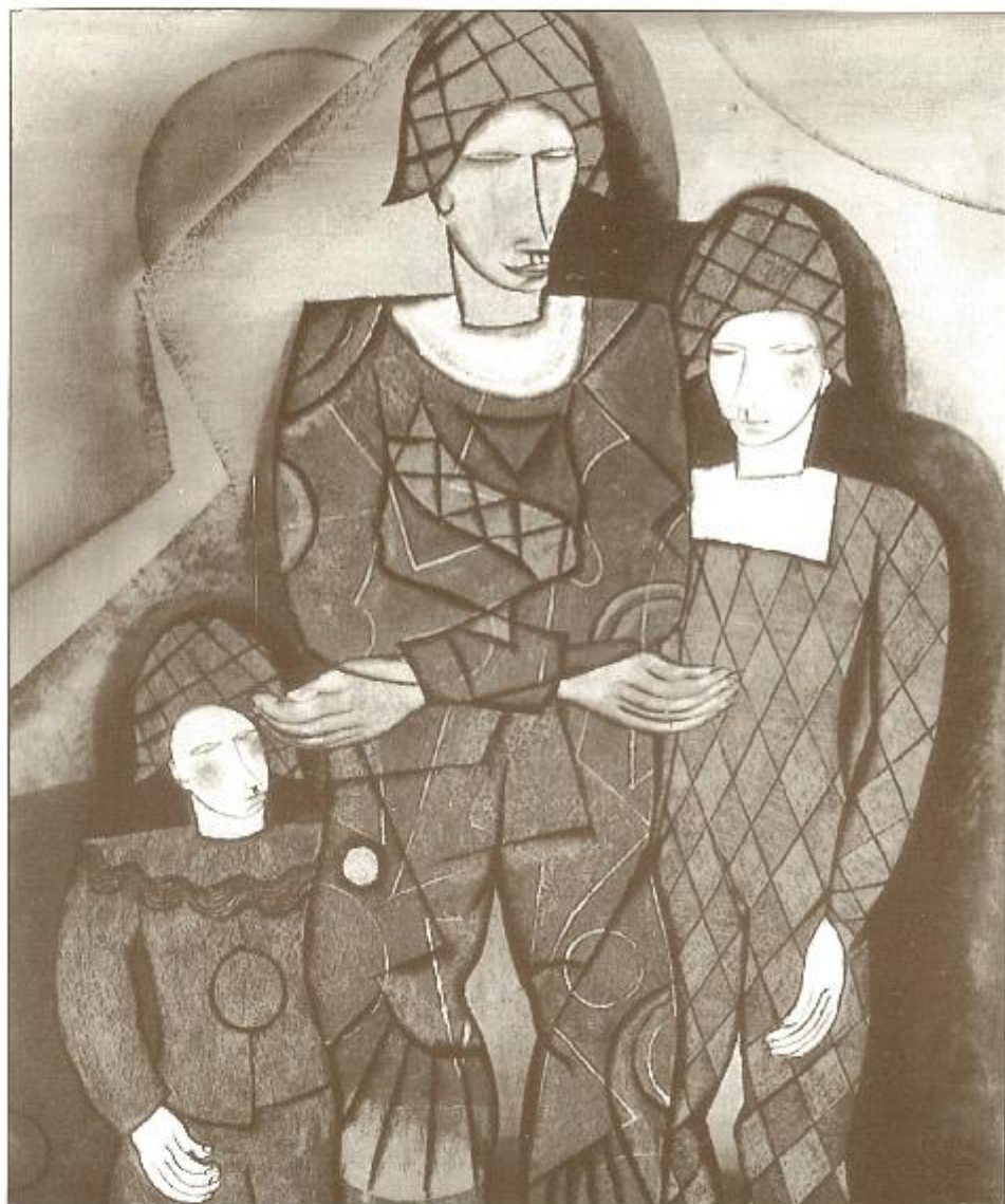
Nr. 8 - F. Jaspers : Familie van drie clowns achterglasschilderij, 100 x 95 cm., PMMK inv. nr. K. 508, Oostende, vroegere verzameling Dr. R. De Beir.

Tijdens de bezetting moest de Antwerpenaar Jaspers «De Vijf Ringen» verlaten. Hij ging wonen in Wallonië (20).