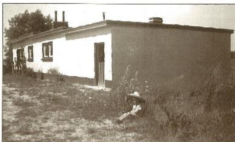
Vijf Ringen huis omstreeks 1936