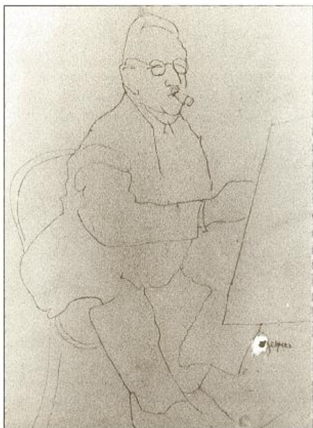
Nr. 6 - F. Jaspers : Dr. R. De Beir, Oost-indische inkt op papier, 36 x 48 cm.