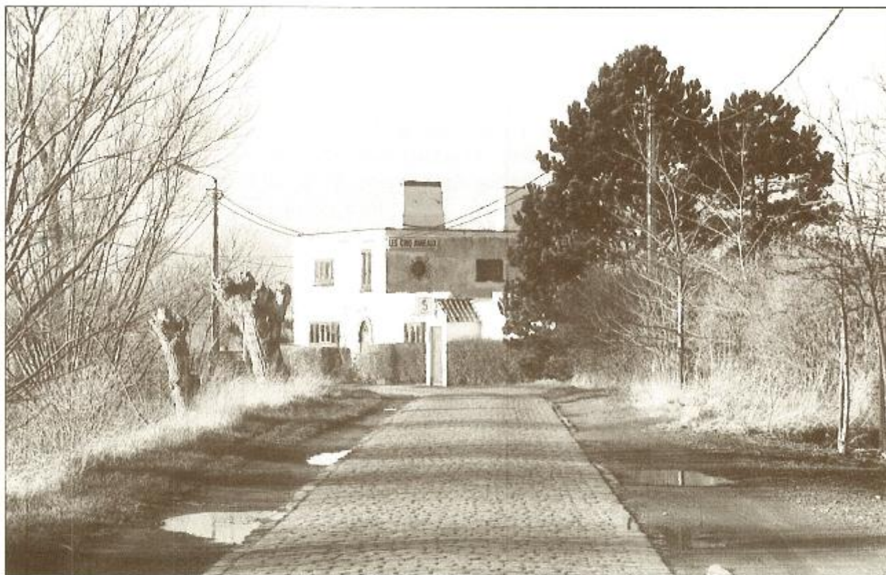
Nr 1 : Foto van de Ringen in 1998

«De Vijf Ringen», gelegen aan de Graaf Jansdijk, was vóór de oorlog het atelier van Floris Jaspers (fig. 1). Thans is het pand, net als «De Hoeve» in de Judestraat, een alombekende nightclub uit de jaren '60 en '70, waar jongeren aanvankelijk op jazz dansten, later op latino-Amerikaanse ritmes en popmuziek. Dancings als maatschappelijk fenomeen ontstonden onder invloed van de Amerikaanse bevrijder.