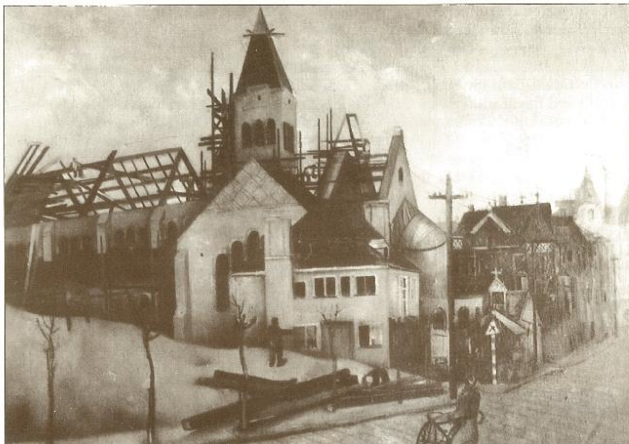
Nr. 4 - R. Jaspers : H. Hartkerk, olie op doek, 80 x 100cm.

In de «De Vijf Ringen» schilderde hij een aanzienlijke hoeveelheid polder- en wilgenlandschappen (fig. 3). De kunsthistoricus Jean Buyck schrijft over deze werken : «In de jaren '30 evolueert Jaspers geleidelijk naar wat een nieuwe top in zijn schilder-kunstig oeuvre kan beschouwd worden : de monumentale landschappen gestoffeerd met dieren...; maar nergens heeft hij zulke waarlijk poëtische evocatie van de natuur gegeven als in die monumentale taferelen van pais en vreë waarin dier en mens zich in een perfecte symbiose met het landschap bevinden ..., de dieren liggen als gebeiteld, hun lijven als massieve blokken in de weide» (16). Van de «tekenende» De Beir maakte hij in één pennetrek een tekening (fig. 6) en schilderde in 1937 een statig portret (fig. 2). «Tennispartij in het Zoute» is een prachtig monumentale verheerlijking van dit gezegend oord : een luxueuse villa met grote lustuin waar elitaire sporten bedreven worden (fig. 7).