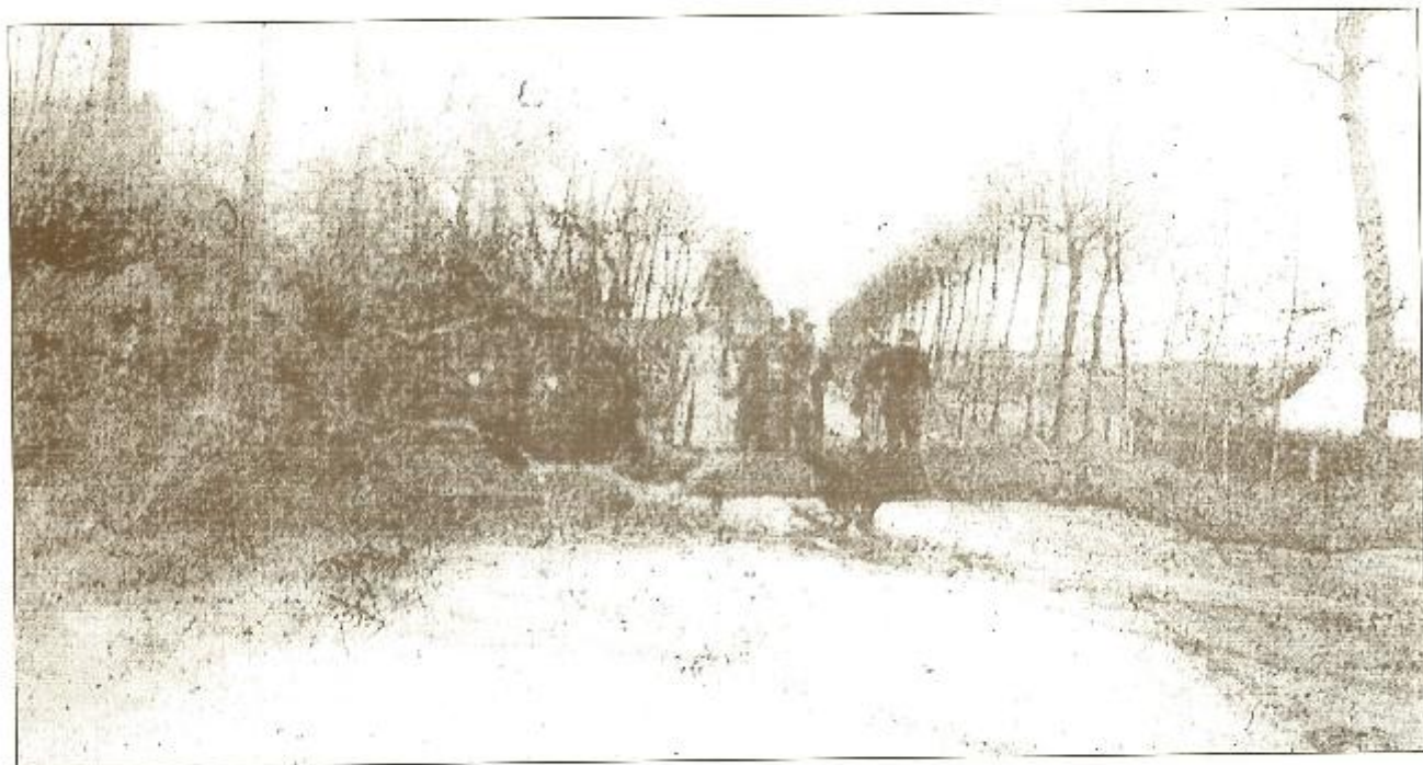
Grensovergang bij St. Anna ter Muiden begin 1915. De baan Westkapelle-Sluis werd versperd met omgehakte bomen.