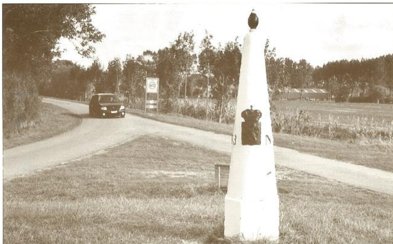
Grensovergang tussen De Vrede en St. Anna ter Muide anno 2004.