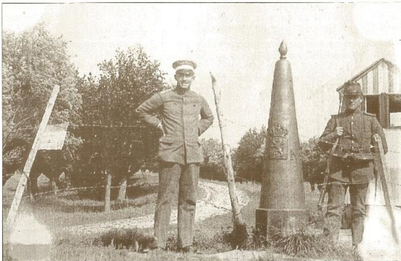
Grensovergang tussen De Vrede en St. Anna ter Muide. Duitse en Nederlandse soldaat bij de grensnaal, die nu nog altijd op dezelfde plaats staat.