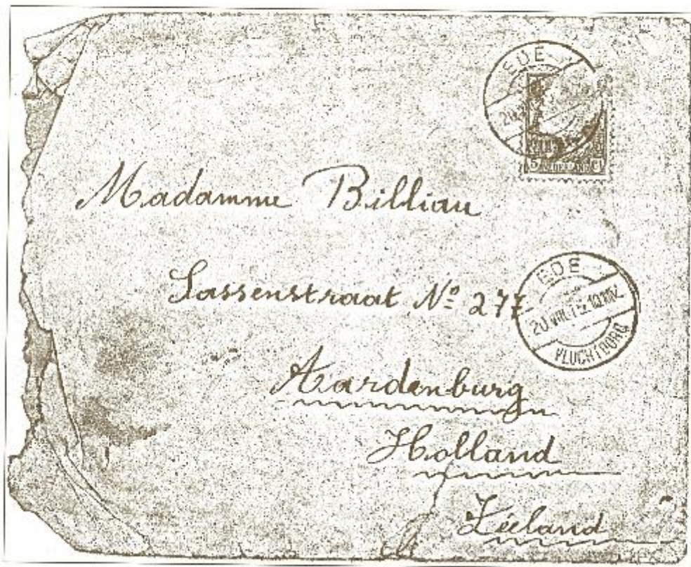
Brief met stempel van het Vluchtoord Ede, verstuurd op 20 augustus 1915.