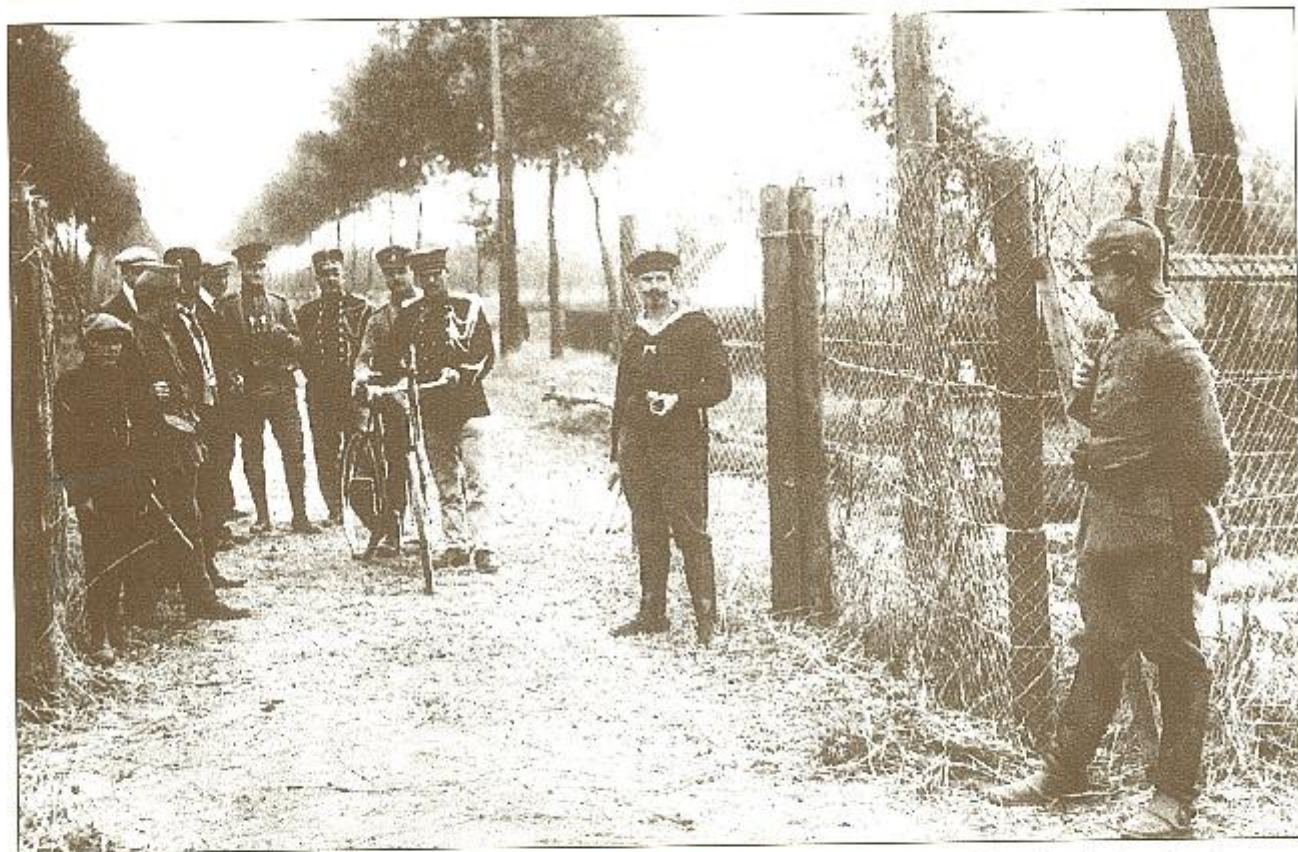
Dezelfde grensovergang in 1916. Aan de doorgangspoort wordt streng gecontroleerd. De elektrische draadverspering van 2.000 Volt is aangebracht. In het midden staan Nederlandse en Duitse soldaten waaronder een matroos. De Duitse schildwacht rechts is een kurassier. Toen de bewegingsoorlog door de loopgraven een halt werd toegeroepen, was er geen werk meer voor de Duitse Cavalerie. Alle Cavaleriedivisies werden verplaatst naar het Oostelijk Front, met uitzondering van één divisie die werd ingezet ondermeer voor de bewaking van de Belgisch-Nederlandse grens.