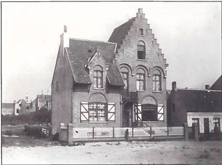
De villa Westendorp aan de noordkant in de huidige Boudewijnlaan. In de achtergrond zijn eerste verblijf in Knokke, de villa 'Amaryllis' in het Duinenpark. De villa werd enkele jaren geleden gesloopt ( Boudewijnlaan nr 64).