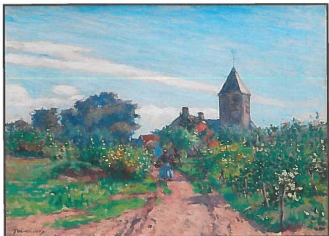
Werk van Westendorp met centraal het kerkje van Knokke.