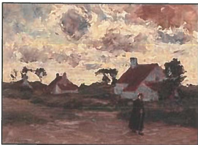
O. Jernberg, Aufziehende Wolken , o/d 35 x 47 cm (Maeger Schorre, Knocke).

Vergelijkende foto van de centrale woning met schouw door het dak van het 'ovenkot'.