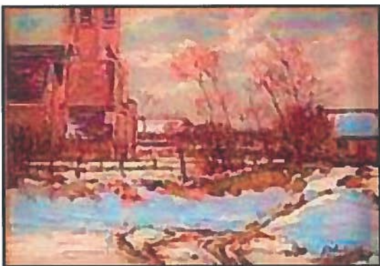
'Winterlandschap in Knocke.'