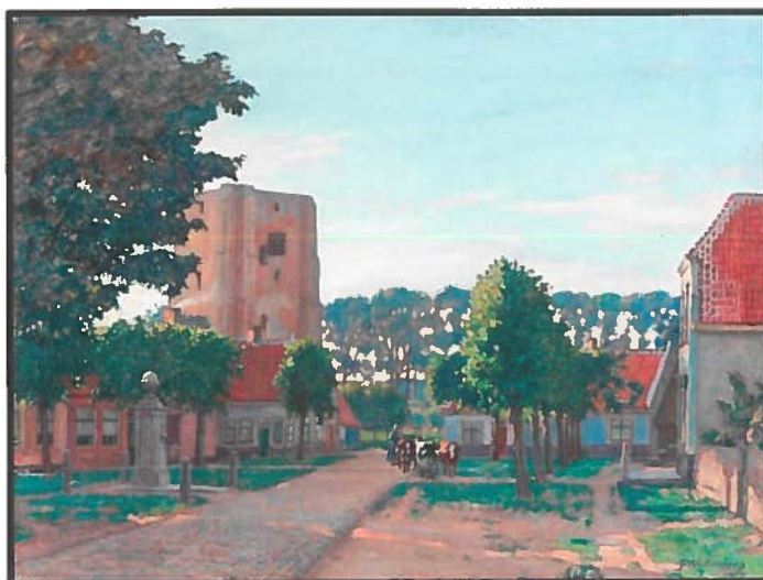
Het eerste werk is betiteld 'St. Anna ter Muiden, Holland', o/d 60 x 80 cm

Tot op heden was bijna geen werk van Westendorp te vinden. Op de site 'Gemälde deutscher Künstler' vonden we onlangs een tweetal afbeeldingen van schilderijen van hem. Hij ondertekende zijn werk met 'Westendorp'; (soms wordt hij ook nog vermeld als 'Westendorf' wat logischer is in de Duitse taal !).