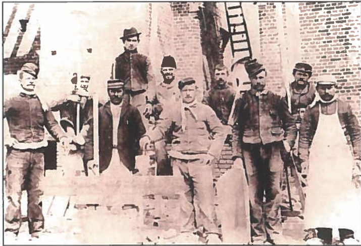
De villa Westendorp in aanbouw door aannemer Deckers, mei 1897.