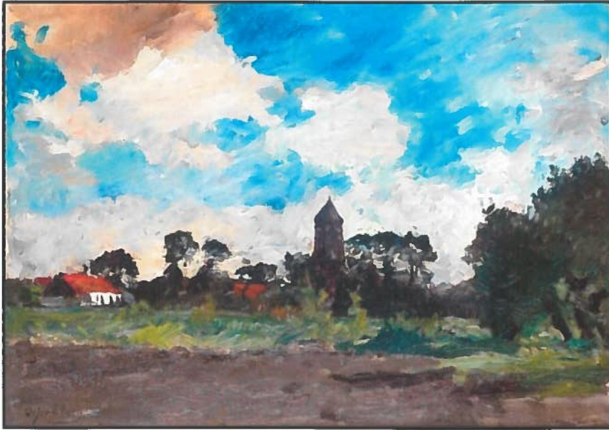
Knokke Dorp met rechtsonder de vermelding 'Knocke'.