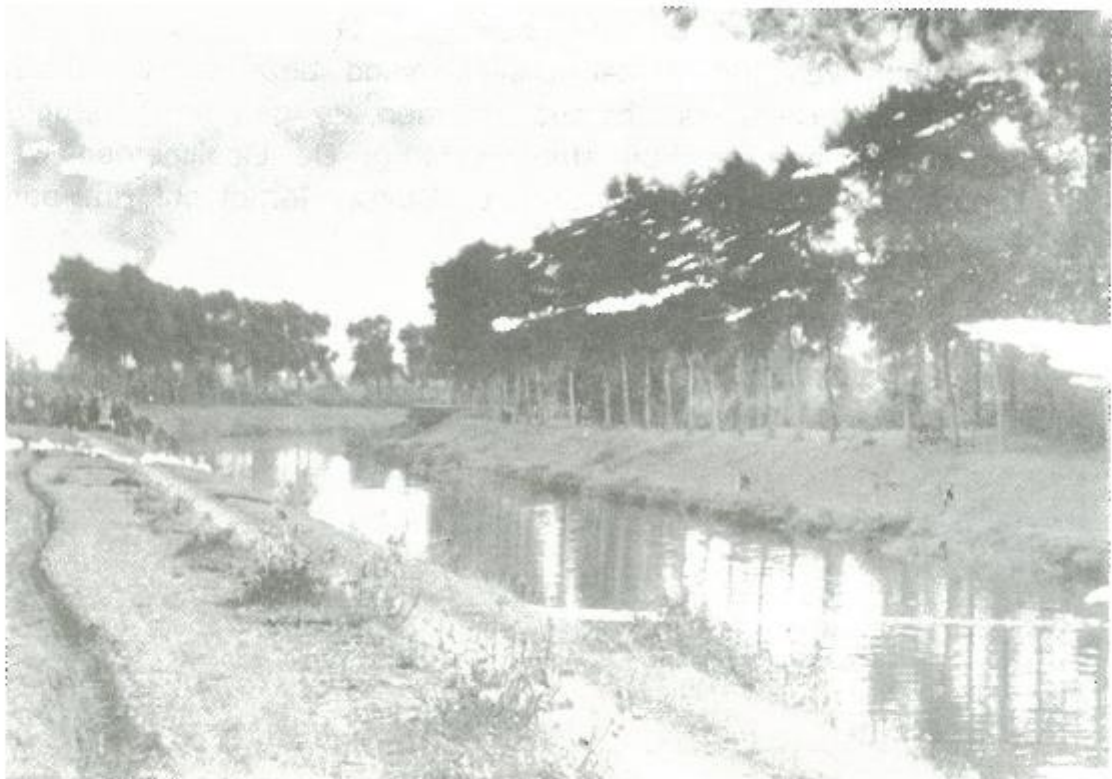
Met vlammenwerpers werd de vijand over het Leopoldkanaal bestookt (Canadese foto oktober 1944)

Na 6 juni en de eerste verwoede veldslagen in Normandië rukten de Geallieerden verder. Drie maanden later waren ze reeds wijd over Frankrijk en kwamen België bevrijden. De Canadezen rukten op langs de kust, door Oostende, Blankenberge, maar raakten met september 1944 niet voorbij Zeebrugge naar de Scheldemonding. Toch bereikten ze Brugge, stopten aan het Leopoldkanaal.