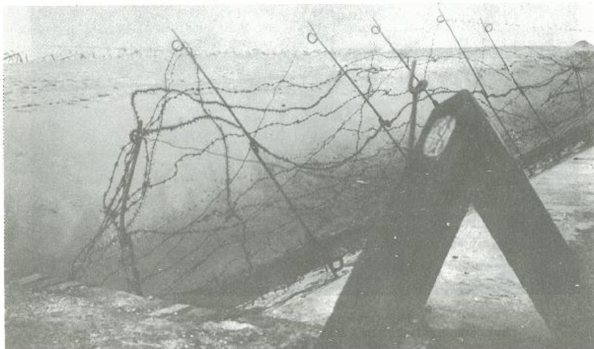
De dijk, over de gehele lengte prikkeldraad en hindernissen

Eisenhower kon vervolgens zelf betreuren dat niet gelijktijdig met de inname van de Scheldestad, de opmars langs de oevers en de eilanden bij de stroom, gepaard ging. De onvermijdelijke zware veldslag voor de "Scheldt Pocket" tekende zich af.