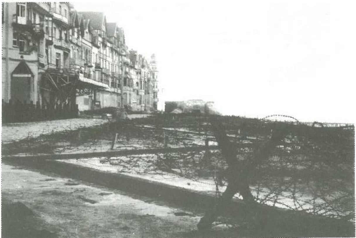
De dijk bij het Albertplein, doorkruist met loopgrachten en prikkeldraad, verderop een bunker