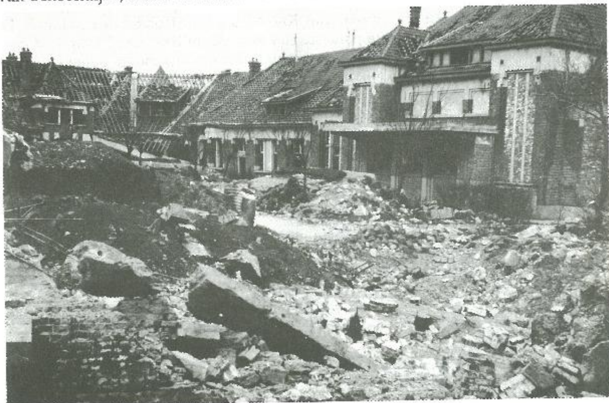
De stelling van het station werd aanvang september 1944 door de Duitsers zelf opgeblazen, terug bezet en nog gebombardeerd.

Op militair plan bleef alles voorlopig nog beperkt tot verkenningspatroeljes en beschietingen. Aldus werd op 28 september de kerktoren van Biervliet beschoten. 's Anderendaags stuurden jagers hun raketten af op de watertoren van Schoondijke, maar ze misten hun doel.