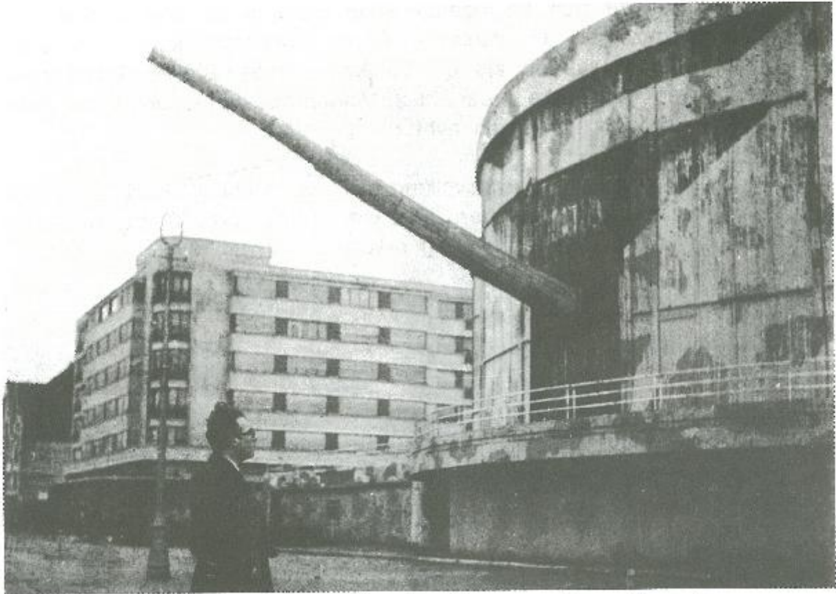
Het Casino werd op vreemde wijze een groot kanon binnen de Atlantickwal van Rommel. Het was een houten bedrieger om de slagschepen tot vuren uit te nodigen. Aan de gevels van de dijkgebouwen hingen spiegels, die de ontploffingen moesten reflektieren, doen geloven dat teruggevuurd werd.