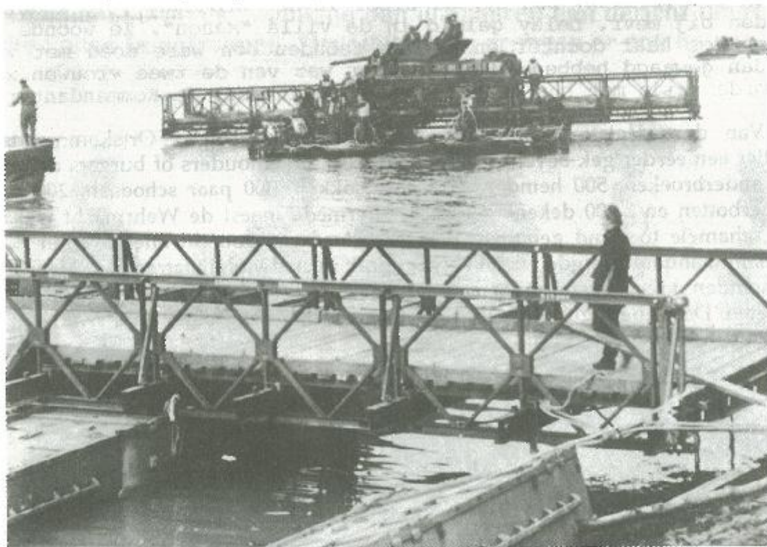
Bruggenhoofd over Braakman (Canadese foto)

Op zaterdag 7 oktober 1944 was de 9e Can. Brigade te Terneuzen met Buffaloes en het 5e Aanvalsregiment. Ondertussen een hevige slag ten noorden van Maldegem, in het bruggenhoofd van Ede, met talrijke tegenaanvallen der Duitsers. Deze beschikten in de buurt over talrijke verdedigingswerken, met alle woningen die als kleine vestingen aangewend werden voor het vuren met automatische wapens. Knokke kreeg met beschietingen af te rekenen, maar met goede moed op een spoedige bevrijding. Alexander Absil had zijn lied "Vivat le