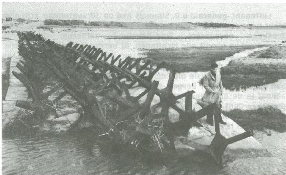
Friese ruiters sloten de monding van het Zwin af

Op deze 29 september uitte generaal Bradley op het hoofdkwartier tegenover Eisenhower de mening dat Antwerpen door Monty niet zou opengesteld zijn voor aanvang november, op zijn vroegst, en dat niet voor 1 december langs deze weg op voldoende tonnemaat zou kunnen gerekend worden voor het beslissende offensief tegen Duitsland. De grote hoop lag daarbij in een offensief half-november. Achter alles zou de terugkeer in de Ardennen tijdens de winter het gevolg zijn van het lange