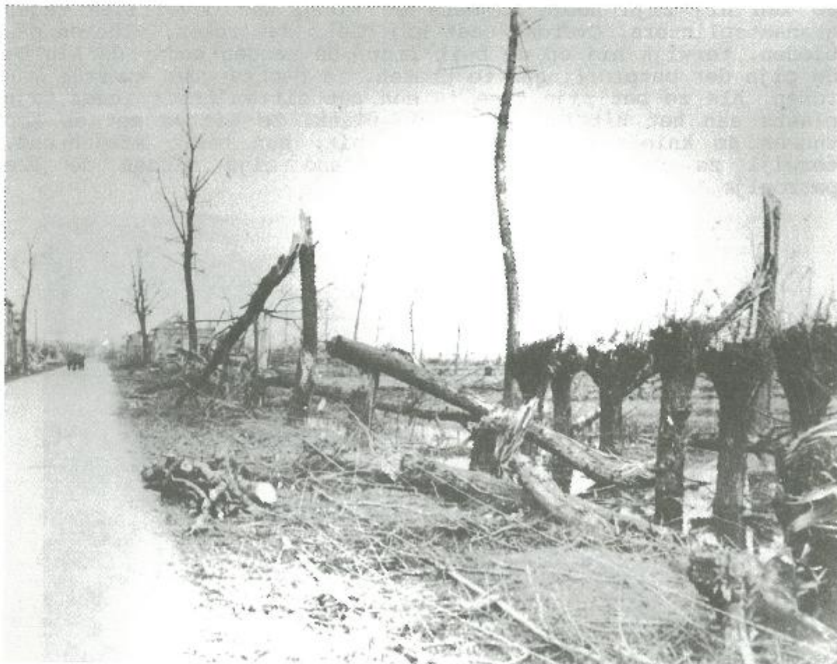
Groot was de vernieling. West-Zeeuws-Vlaanderen werd het meest getroffen, waar weken nodig waren om de laatste Duitse weerstand te breken.

Maandag 10 oktober werd onthouden als het "einde van het begin" voor de Canadese krijgsverrichtingen, met een smal bruggenhoofd over het Leopoldkanaal, voor ieder meter grond gestreden. Maar de 9e Brigade was over de Sovajaardplaat van de Braakman en deed de druk op de 7e Brigade van het bruggenhoofd afnemen. Goed nieuws.