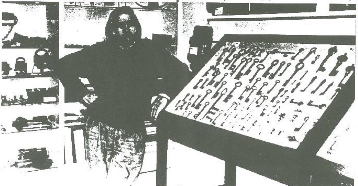
RAF : een sleutel voor alle situaties

Knokke-Heist, dat altijd zuinig omgesprongen is met zijn centen en dus nooit personenbelasting heeft ingevoerd, zou daarvoor nu moeten gestraft worden en helpen betalen voor steden en gemeenten die door wanbeheer en onkunde in diepe schulden zijn geraakt.