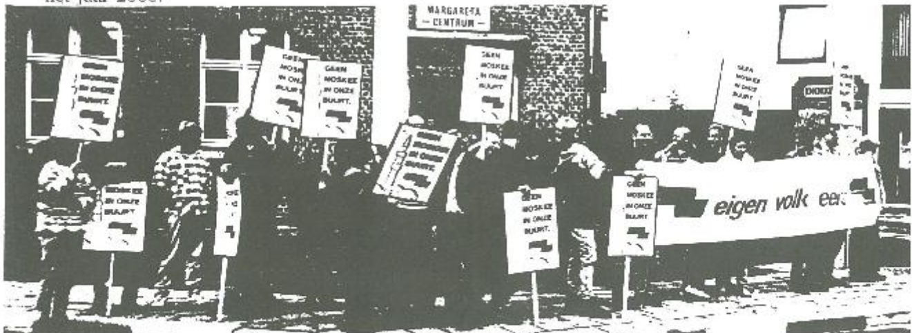
Het Vlaams Blok kwam manifesteren aan het St-Margaretha-centrum, waar de 60 moslems uitkeken naar een moskee