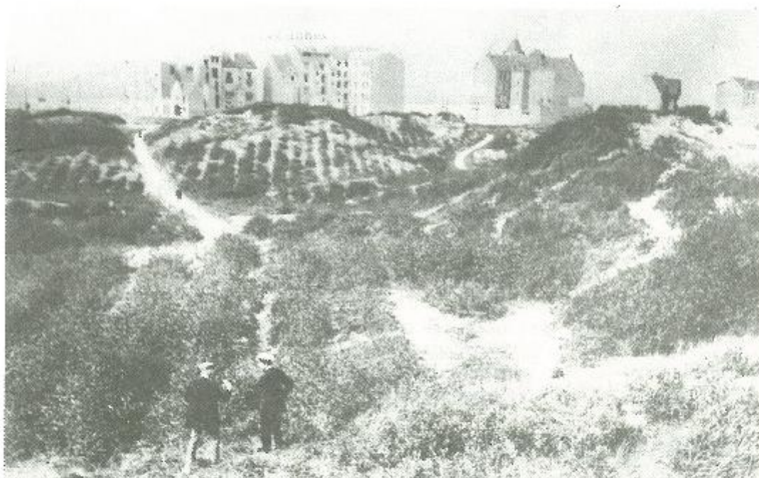
Waar nu de buurt van de Heilig Hartkerk is, in 1900 de duinen naar het Grand Hôtel toe.