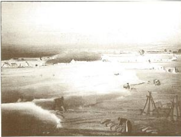
3 - Albert Servaes, «De Oogst», olie op doek (78x71 cm), gesigneerd en gedateerd 1943.