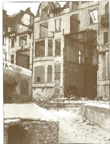
6. - De gebombardeerde «villa's» aan de Zeedijk op 2 september 1944.