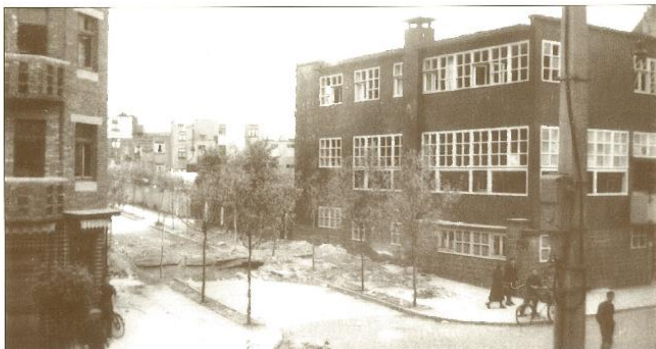
2. 20 juni 1944. Krater van de geallieerde bom in de Mosselmanstraat aan «Villa De Beir».

De schilder aanvaardt het voorstel en betreft Villa Alsace.