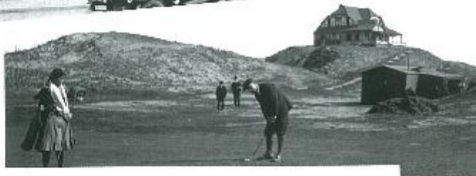
Wijk Knokke - Paradijs