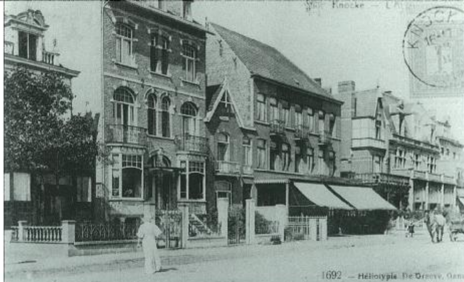
De 'Lion d'Or' (1) met overdekt terras, langs de westkant van de 'Avenue vers la Mer' gefotografeerd in 1899.