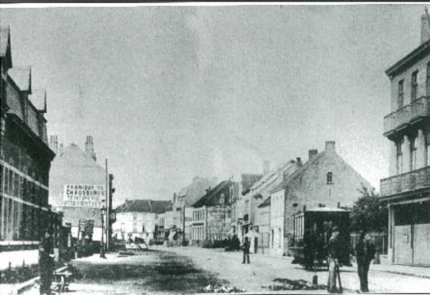
Zicht genomen vanaf de kerh : de Lippenslaan met duidelijk zichtbaar het vooruitspringend hotel met zuiddak.