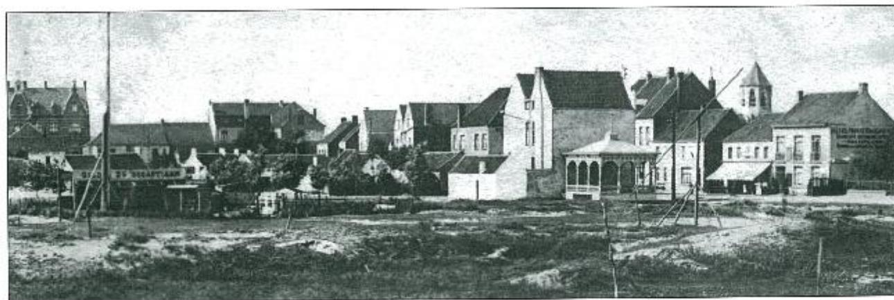
Knocke-Dorp in 1900 met 'Hôtel de Bruxelles', (3de gebouwe, voorbij de kloak, rechts de 'Prince Baudouin').

Na de slooping van het oude hotel werd het nieuwe 'GRAND HOTEL DU LION D'OR' gebouwd op de nieuwe rooilijn van de Lippenslaan met de toekomstige Boudewijnlaan. Het werd een eenvoudig gebouw met gepleisterde gevels, een gelijkvloers en één verdieping hoog. (kort voor WO I met een verdieping opgetrokken en een platte bedaking).