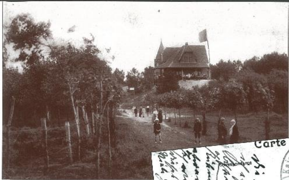
Voor- en keerzijde van een postkaart verstuurd op 6 november 1915 Eenheid: 2de Matrozen Regiment. Het 3de Batalion verbleef te Knokke Met 2 compagnies van 1/10/1915 tot 30/11/1915.