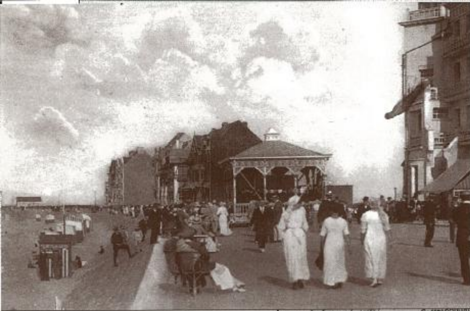
Voor- en keerzijde kaart met de verplaatsbare muziekkiosk op de zeedijk in het Zoute bij het Grand Hôtel du Zoute Eenheid: 5de Matrozen Regiment.