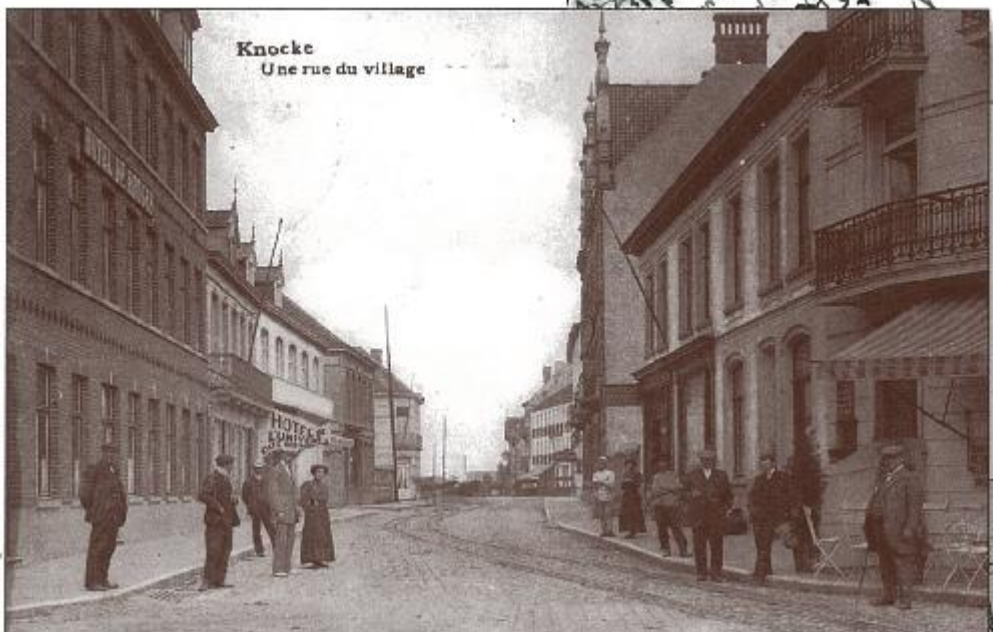
Knokke Une rue du village