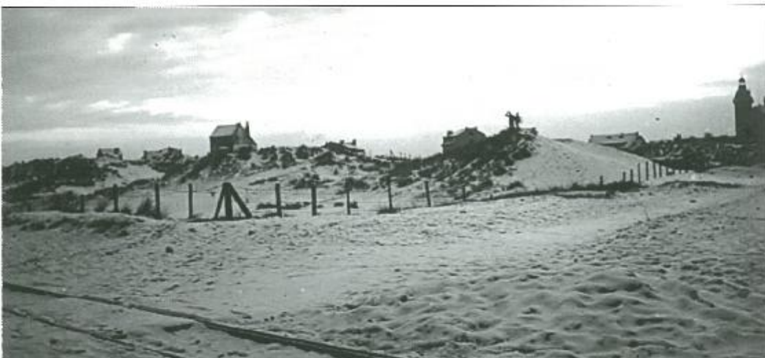
Foto-opname Knokke 26 november 1915, op de bezijde staat in het Duits geschreven: "de eerste sneeuw in Vlaanderen".

Steeds maar storm en regen met als ergste gezel, de 'Belgische sneeuw' namelijk het duinezand. Als gevolg van de zware stormen nestelt dit zand zich in alle hoeken. Maar we blijven hier niet lang meer. Binnenkort is het weerom rugzak aanriemen en gaat het richting loopgraven. Daarenboven is het ook nog bitter koud. Hoofdzaak is dat het goed met ons gaat en dat we niet te klagen hebben."