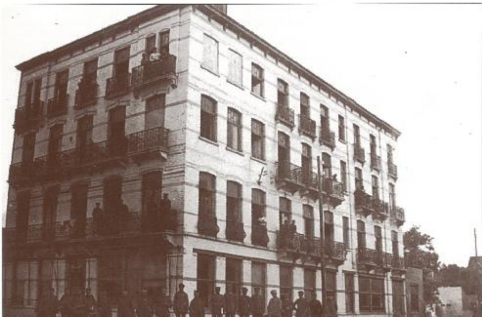
Deze soldaten van de machinegeweercompagnie van het Infanterie Rgt nr. 157, lieten zich in 1917 met hun machinegeweren fotograferen bij hun rustkwartier 'Hotel Düsseldorf' bij de huidige Elisabethlaan. Later kreeg het de naam 'Hôtel de la Paix' en 'Wellington' (gesloopt 1990).

Uiterst rechts de villa 'Le Trenblais' met torentje in de buurt van het huidige Ijzerpark, centraal achter het dun de schoolkolonie L'Yser.