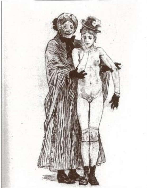
'Ma fille, monsieur Cabanel' Est van Feijfen Rops.

monsieur Cabanel' waarop een oude lelijke vrouw een naakt jong meisje aanbiedt aan een klant. Neel stond ook model voor beeldhouwers als Paul de Vigne en Charles Samuel.