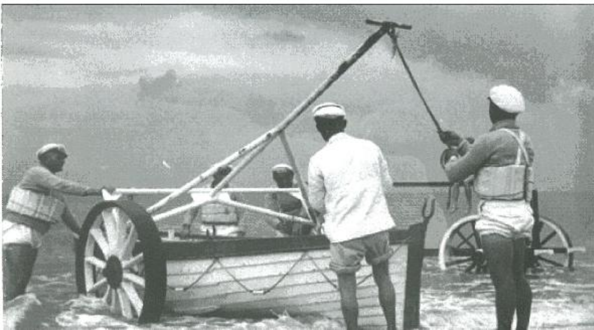
Om het lastige laden van de boot te vermijden maakte men een constructie waarvan de boot opgehouden werd.