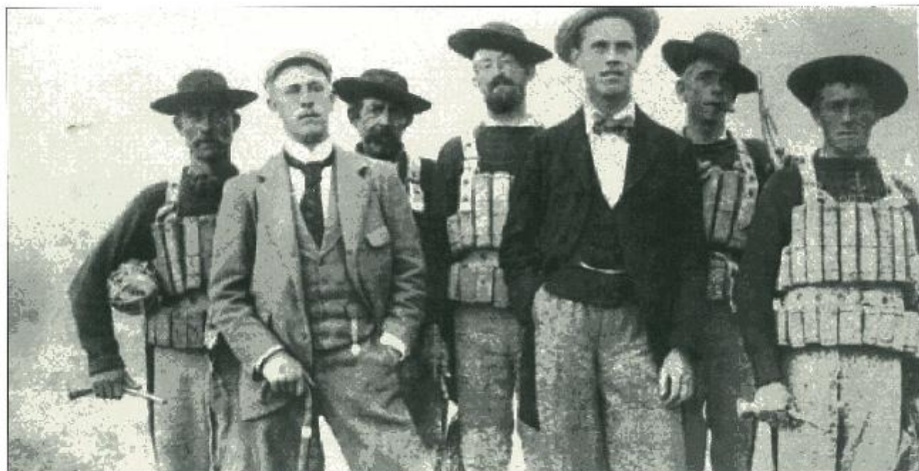
Souvenir de la Catastrophe de Kwocke, 22 juillet 1896. Offert aux courageux sauveteurs.