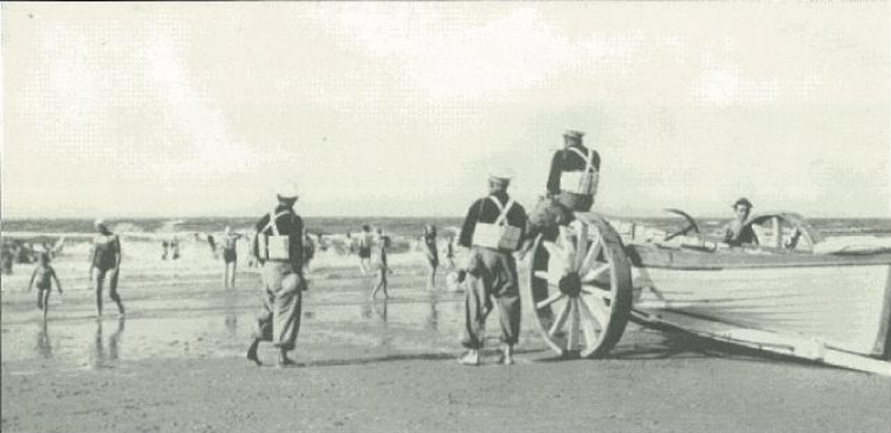
Hij afgeand tij en zeegang is het voor de redders opletten geblazen.