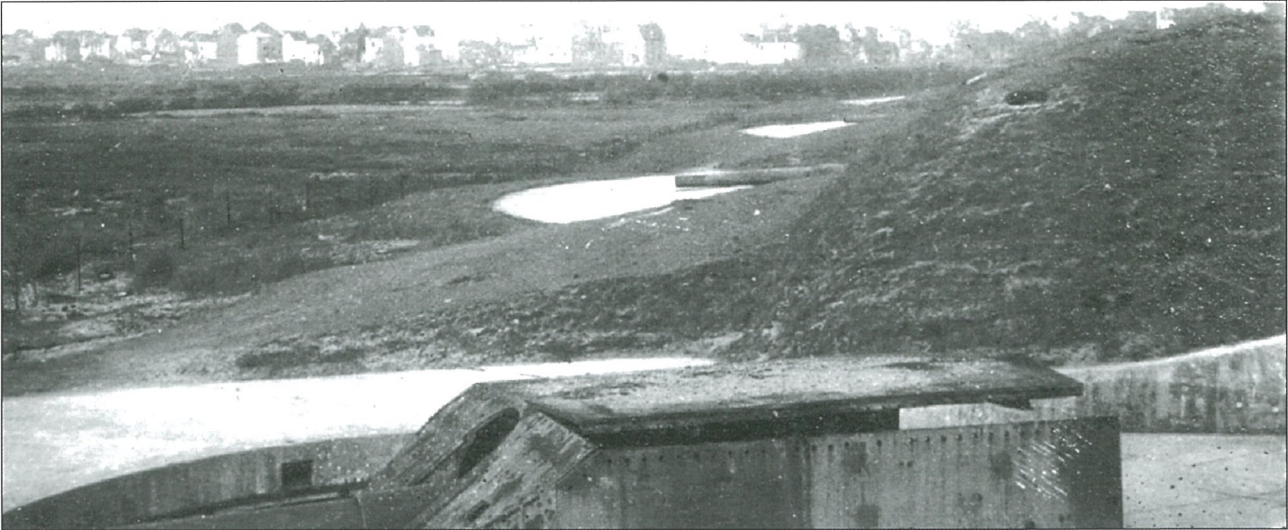
Drie amateurkiekjes genomen door een Britse toerist in 1921 van de Kaiser Wilhelm II batterij.