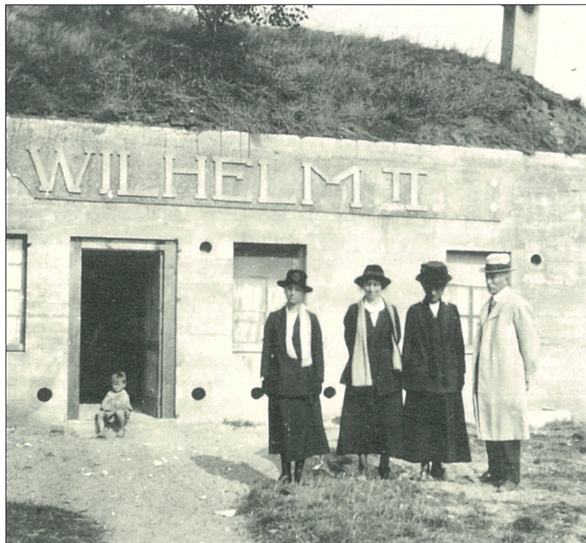
Britse toeristen bij de Wilhelm II batterij beginjaren 1920.

Andere plaatsen zoals de batterij Deutschland te Bredene (4 x 38 cm) kenden geen grote toeloop van fronttoeristen, de batterij Pommern (Lange Max) bij de Leugenboom te Koekelare daarentegen was wel een groot succes.