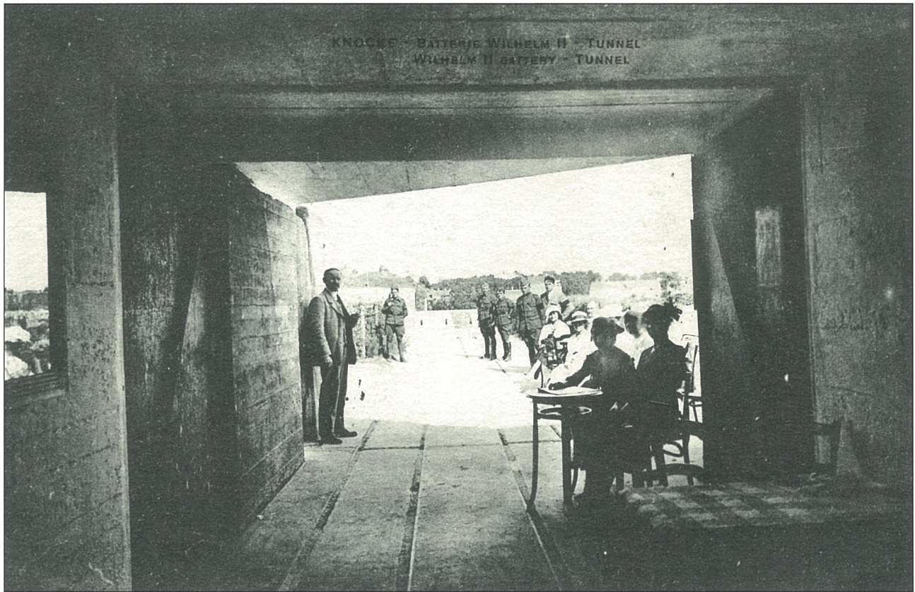
Toegang tot het bunkercomplex en tunnel. Twee vrouwelijke vrijwilligers staan in voor de ticketverkoop. Het aantal postkaarten uitgegeven van de 'Batterij' is niet te tellen! (archieff Cnocke is hier).