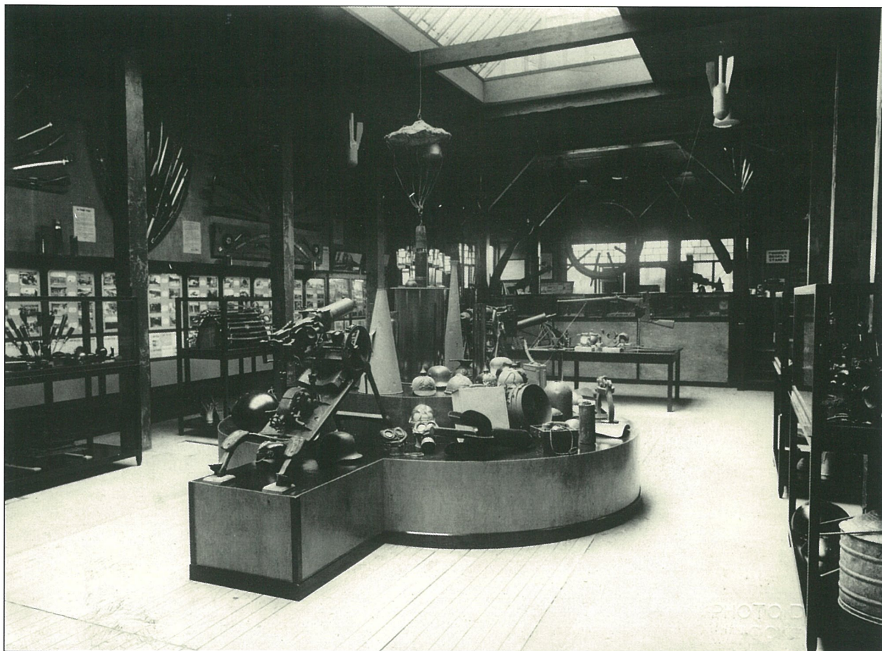
Centrale tentoonstellingsaal van het museum (archief Cnocke is hier).

Andere oorlogsoorden uitgebaat ten gunste van het Nationaal Werk voor Oorlogsinvaliden waren: de onderstand van de Duitse admiraliteit te Middelkerke, de Grote Redan te Nieuwpoort, het kanon Lange Max te Moere en de Dodengang en Bloemmolens te Diksmuide.