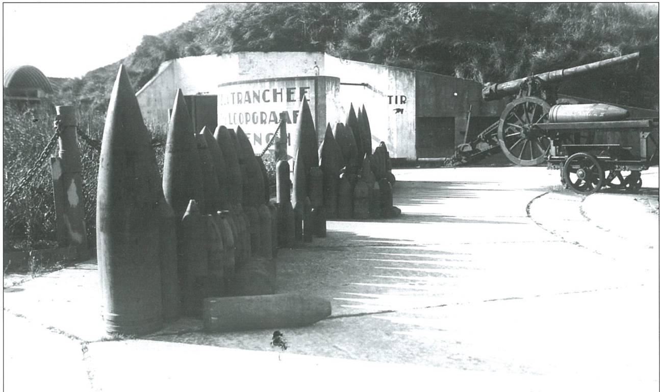
Beeld van enkele obussen van het openluchtmuseum; rechts een 'kar op spoor' voor de aanvoer van de projectielen (archieff Cnocke is hier).