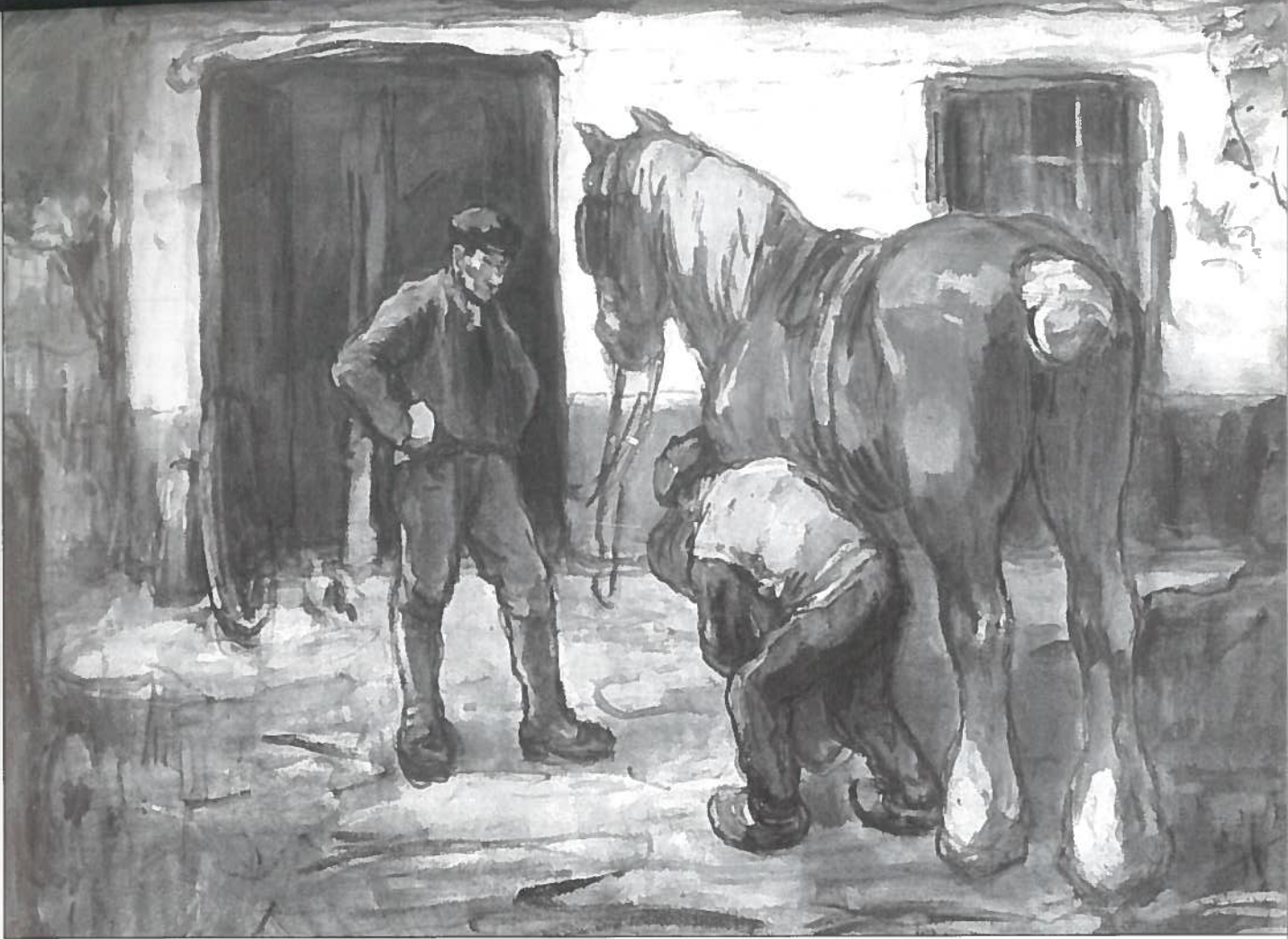
De Smidse van het Kalf.