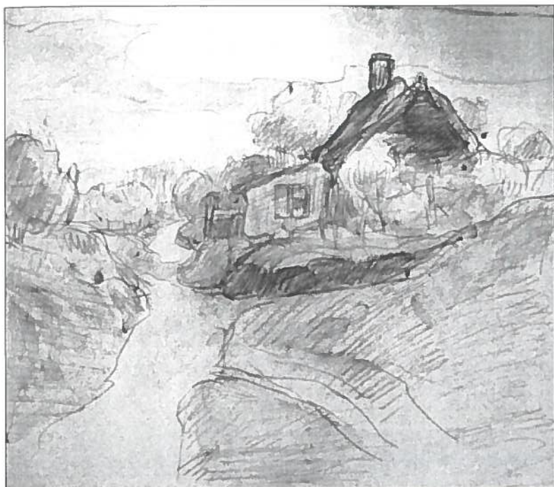
Potloodschets van een dorpsstraatje.