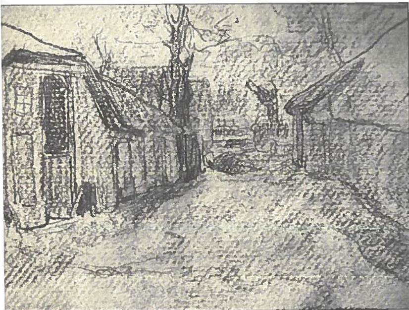
Schets op karton van een hoeve, vermoedelijk in Knokke.