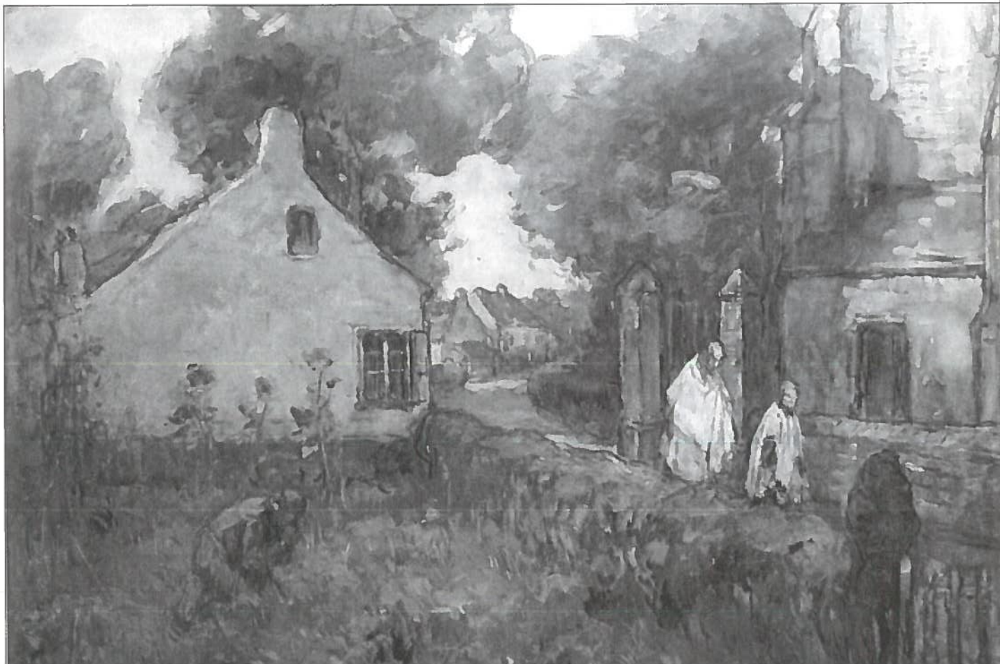
De Berechting (Kerkstraat).