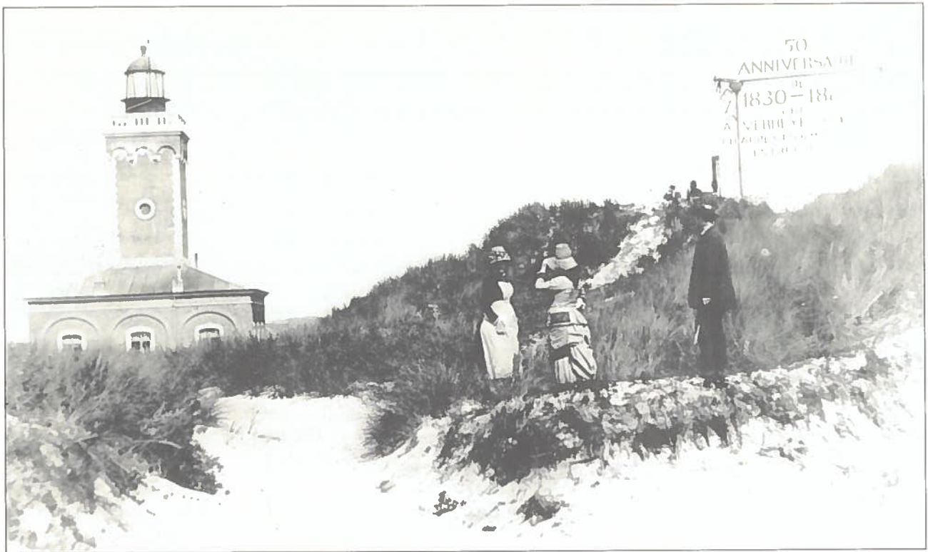
Knokke-Bad met de vuurtoren en het 'Pavillon du Phare'. Op de zijgevel zien we ook de letters MENT, van het woord 'Rafrachissement'.