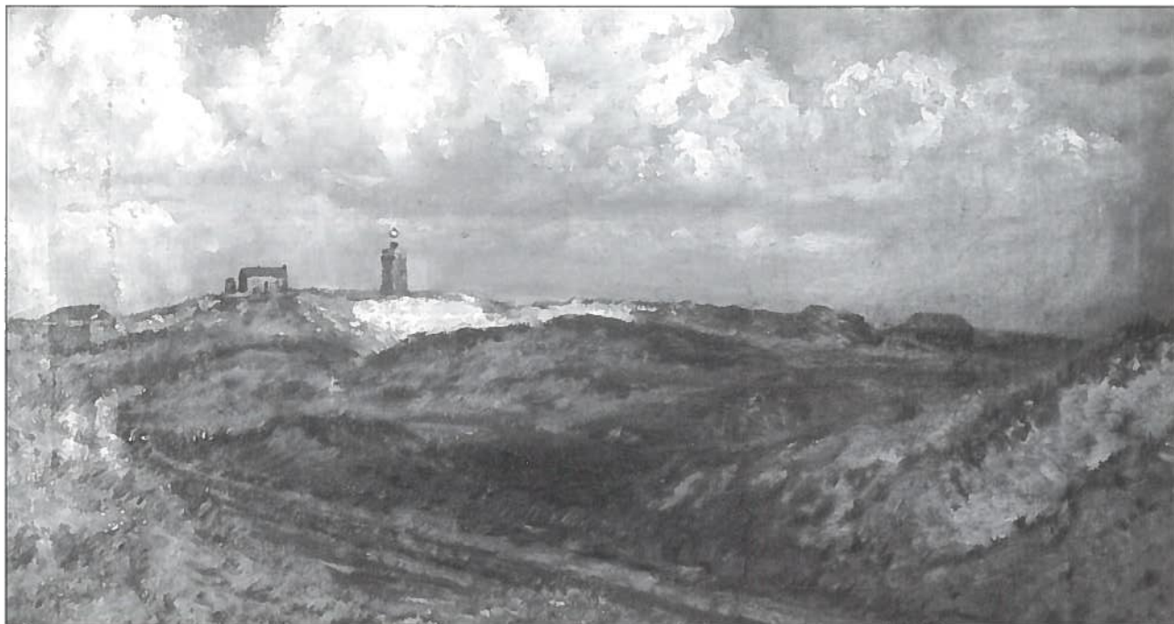
De Zeeweg (Knokke) olie op doek, 54 x 79 cm, privéverzameling Knokke-Heist.

Een van onze leden is in het bezit van een merkwaardig olieverfschilderij van kunstschilder Antoon Joostens (Brugge 1820-1886). Joostens was afkomstig uit Brugge en schilderde meestal stadsgezichten van Brugge en historische taferelen.