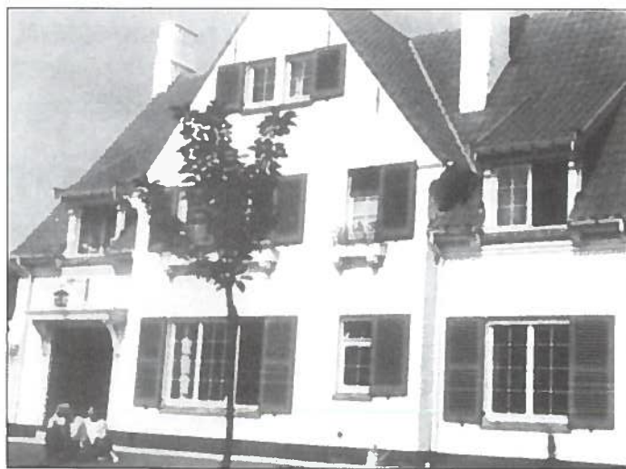
De villa "La Garoupe".