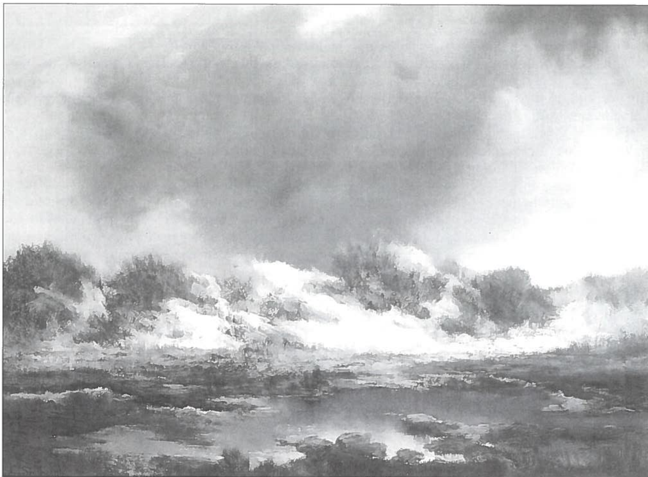
J. Van den Seylbergh, Het Zwin, pastel, 92 x 109 cm, Gem. Patr. Knokke-Heist.