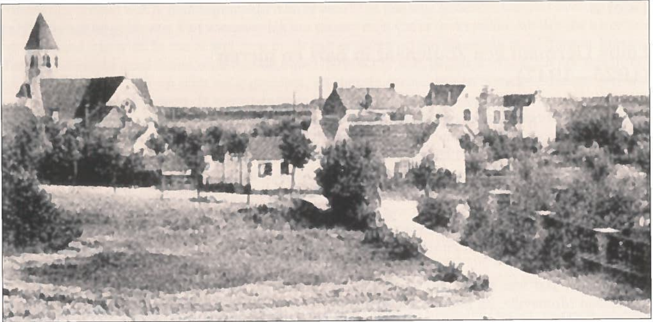
Het Zoute anno 1927.