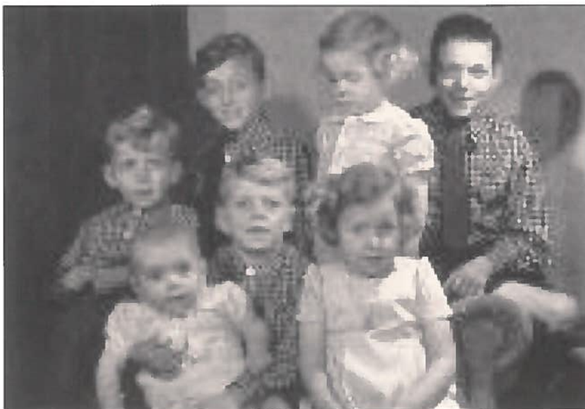
De zeven kinderen.

verdiepingen, dus kuisen geblazen. Mevrouw beviel van een meisje thuis. Ik moest alles opruimen en de moederkoek in de hof begraven. Gelukkig was er een hof, want met al die kinderen in huis. Ik deed 's morgens de kinderen naar school, 's middags gaan halen, en dan terug na het eten. Om 4 uur na de school terughalen. Ik moest geen werk vragen. Alle dagen moesten de schoenen gepoetst worden. Mevrouw was elk jaar in verwachting en dus kon zij niet veel helpen. En als ze niet zwanger was had ze dikwijls krampen, en moesten haar man en ikzelf warme kompressen leggen, en dat was meestal 's nachts. Dus werk genoeg. In de jaren die volgden kwam er elk jaar een jongen bij. Mijnheer had een kunstbeen, dat was in leder en werd met een riem over de schouder vastgemaakt. Hij ging met een stok, hetgeen hem goed afging. Hij had in zijn studententijd tijdens een voetbalmatch zijn knie gekwetst en het been moest worden geamputeerd. In die tijd waren ze nog niet op de hoogte van al die nieuwe uitvindingen. Onder al die kinderen was er een meisje, welke opluchting toen. Nadien waren het altijd maar jongens. En toen ik onder de oorlog in de jaren 1942-1943 van plaats veranderde waren er bijna tien kinderen, waarvan één meisje. En zo lang ik het heb kunnen volgen zijn er dertien kinderen geboren waarvan in totaal twee meisjes. Mijnheer overleed in 1976. Ik ben toen naar de begrafenis geweest en heb daar alle kinderen terug gezien. Mevrouw overleed in 1996.