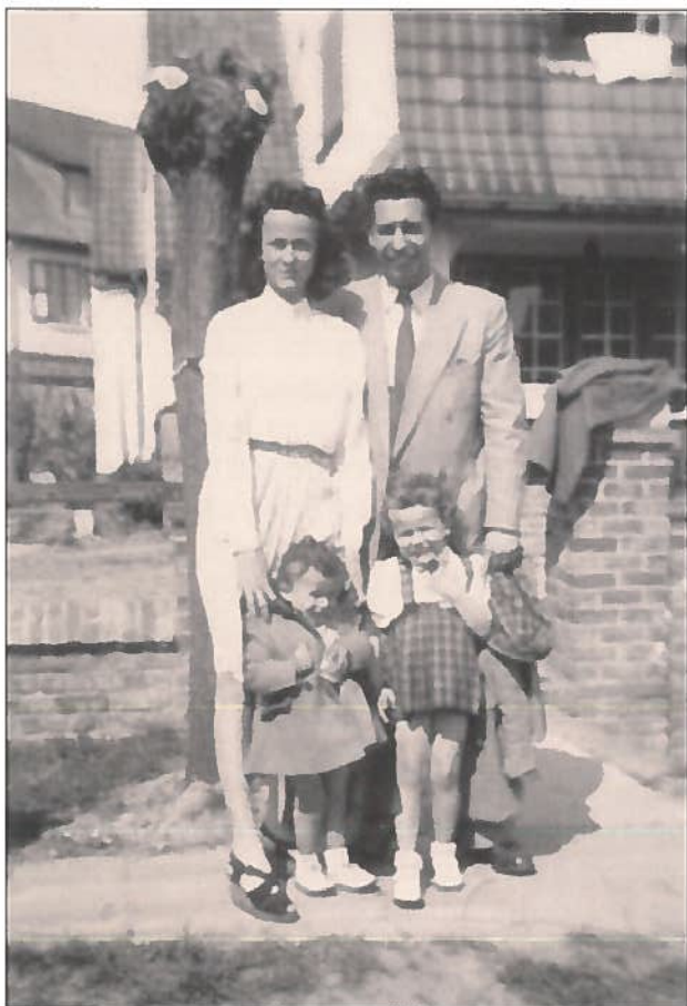
Familie Vastapane voor villa 'Relache' te Knokke-Zoute. (14 april 1945)