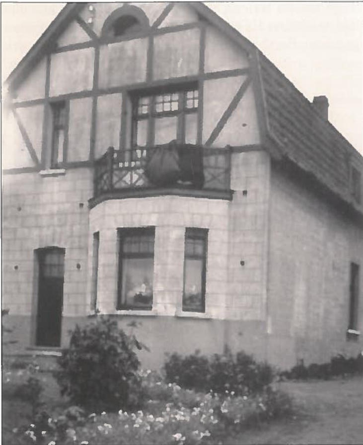
Ons huis te Kesterbeek.