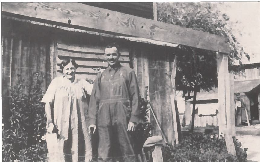
Mijn ouders vóór de woning in Los Alamitos.