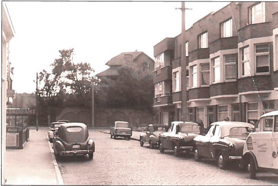
De Blancgarinstraat kort voor de afbraak van de villa in 1956.