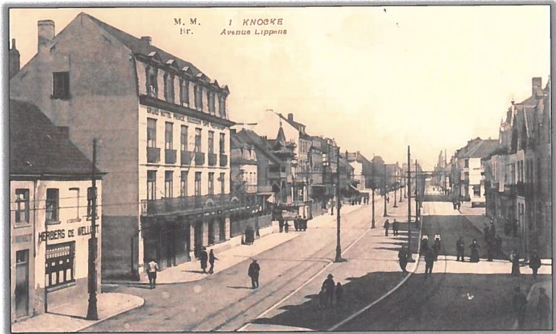
Café 'De WELLUST' bij het 'Hotel Prince Baudouin' in de vroege jaren '20.

De Blancgarinstraat was niet de enigste straat die werd verlengd in westelijke richting of naar het Albertstrand. In 1929 moest 'Café Wellust' worden gesloopt om de Prins Boudewijnstraat verder aan te leggen. De grond was eigendom van schilder Achiel Strobbe (*Lissewege 25.05.1897/ + 1929).