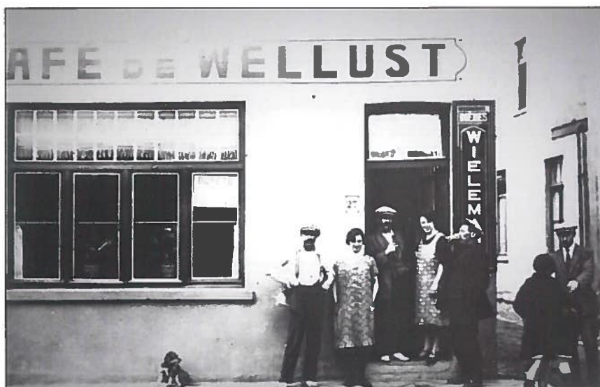
Steffe en Achiël in het deurgat van hun café.