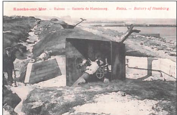
Vernielde kanonnen bij het strand (Hamburgbatterij - Albertstrand.

Het is een schrikkelijk schouwspel om de batterijen te zien die ontploft zijn...vele munitie is er daar nog te vinden. De militaire genie is van gedacht dat alles te komen onderzoekingen.