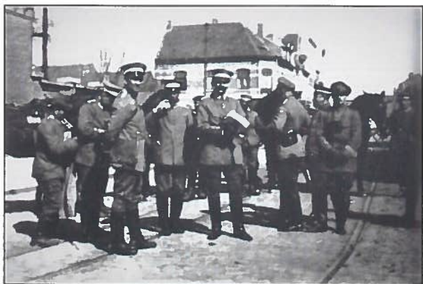
Duitse officieren ter hoogte van Hotel de Bruges en 'Café du Tram' in de Lippenslaan.

Dinsdag 8 oktober, Om twee uren stonden in de Lippenslaan van vijftig tot zestig wagens bespannen met paarden. Er was meel tekort voor de bevolking.