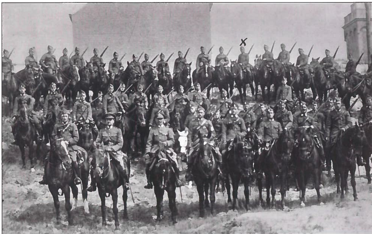
De Lanciers te paard gefotografeerd in 1918 in de buurt van de vuurtoren.