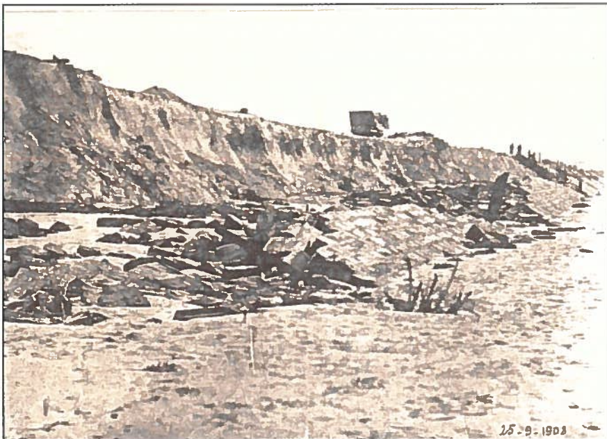
Een dijkbreuk in de pas aangelegde dijk van het Zoute in september 1908

Wat ware er gebeurd met een storm van zonnestand of van nachtevening? (springtij)