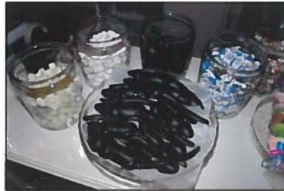
Zwarte 'muizetjes' en zachte 'nunnebillen'.