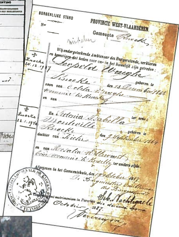
Trouwboekje van Leopold Waeghe en Sidonie Monteville, 19 oktober 1887