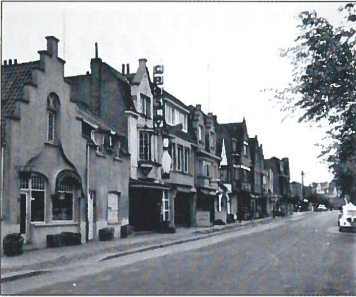
De Sparrendreef met links de 'spekkenwinkel' en aanpalend de 'Crosley Bowling' in oktober 1962.