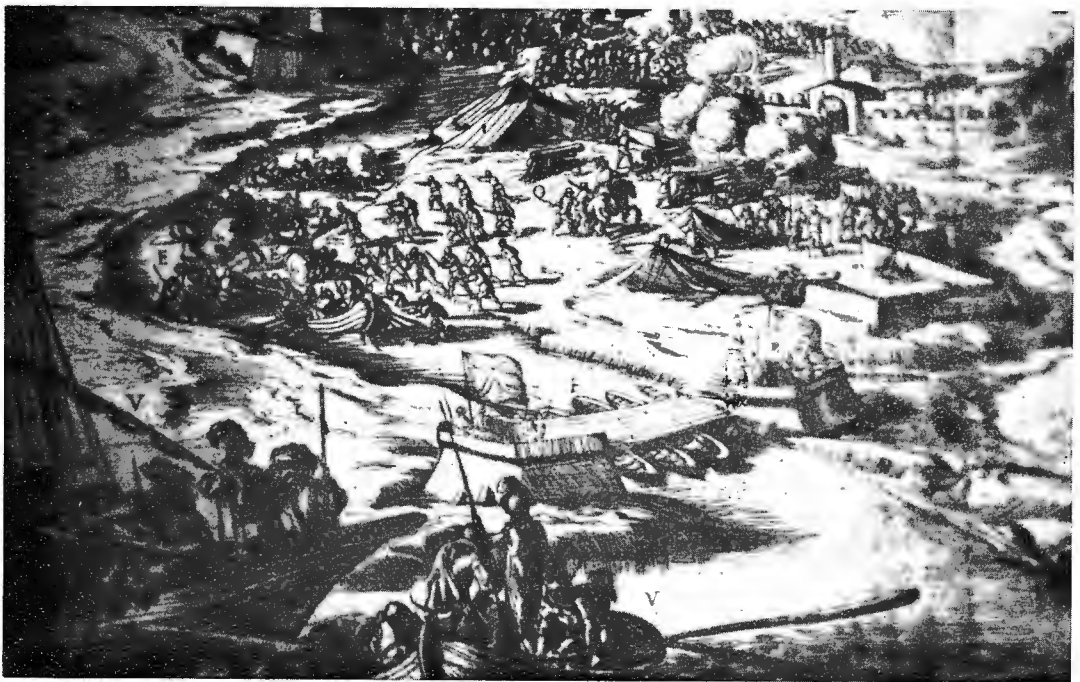
Fragment van de ets door Cortese op het stadhuis van Sluis (blz. 104)