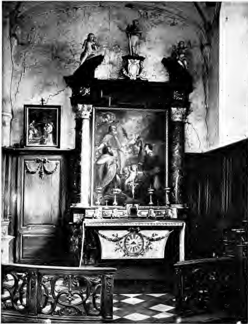
Het St.-Kwintinsaltaar te Oostkerke