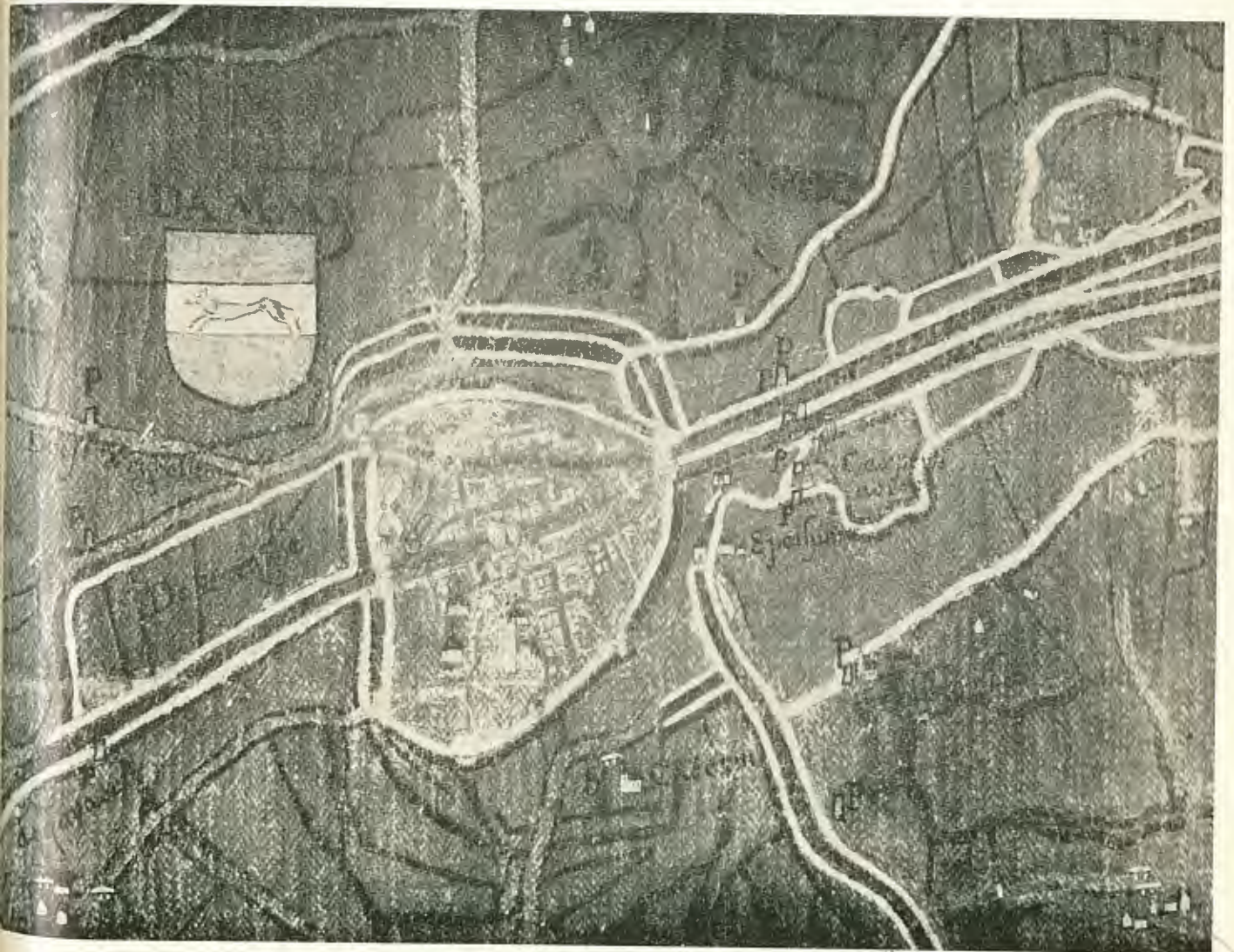
Damme : omwalde gedeelte en paallanden - Volgens Pourbus omstreeks 1570