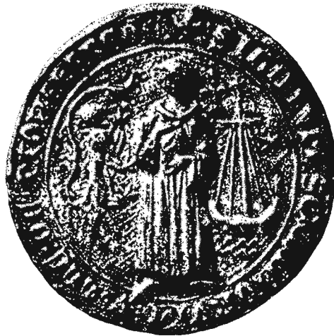
Zegel van de stad Monnikerede 1309